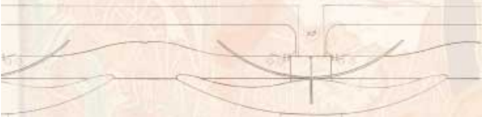
SECTION THROUGH LEAF